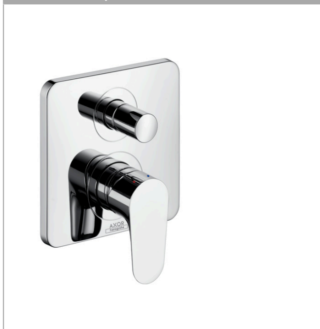
Ilustración del producto